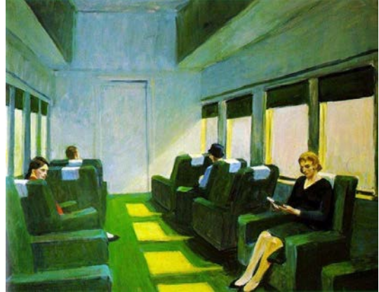
Imatge 4. Edward Hopper. Cotxe de seients, 1965. Oli sobre llenç, 127 x 101.6 cm.