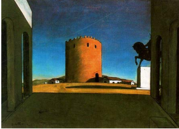
Imatge 3. Giorgio de Chirico. Torre vermella, 1913. Oli sobre llenç, 73.5 x 100.5 cm.