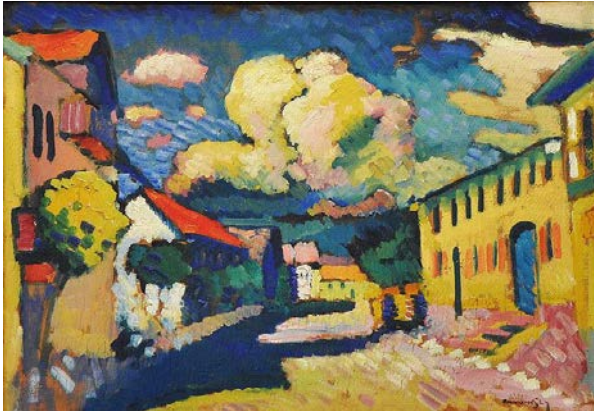
Imatge 5. Vassily Kandinsky. Carrer de Murnau, 1908. Oli sobre llenç, 48.0 x 69.5 cm.