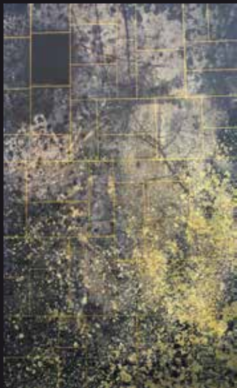
Ca la Puça