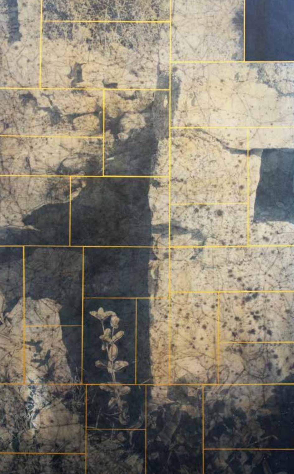
Cal Pere Rafael