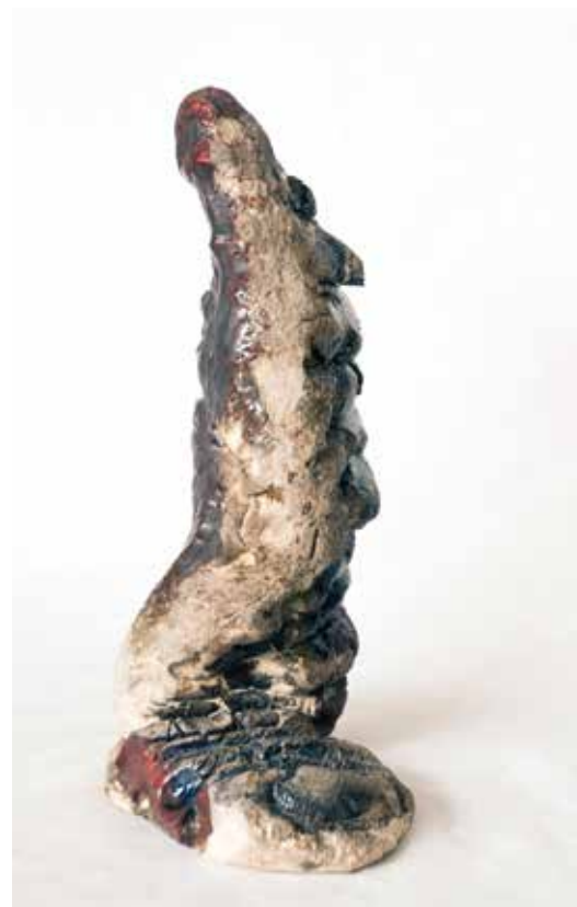
LUZE 39x23x23 2015