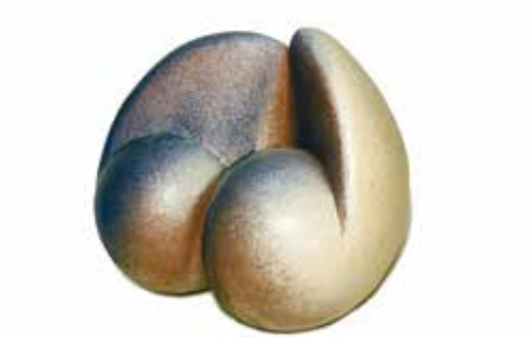
AVENC 35x37.5x33 3-1986/11-2015