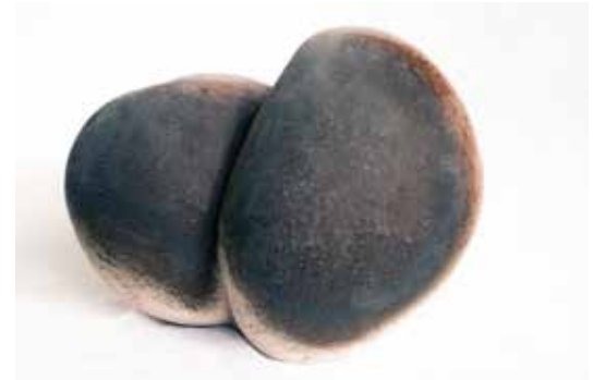
BLANDESSA 31x31x24 3-1986/11-2015