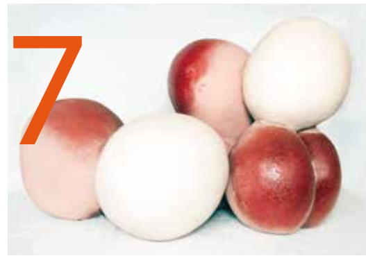
DHARMA 35x35.5x150 6-2016