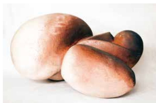
HUMILITAT 75x50x45 6-2017