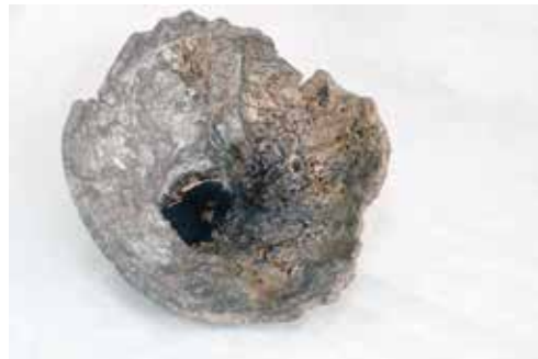
FORNADA AFRICANA 2-1988