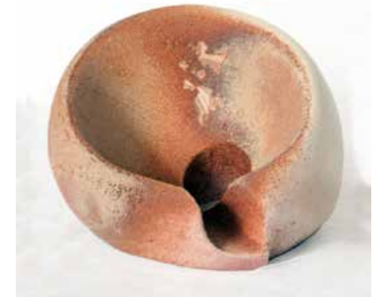
VUIT 30x30x21 8-2016