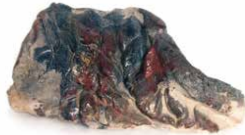
TEMPORAL 43x37.5x21 1987