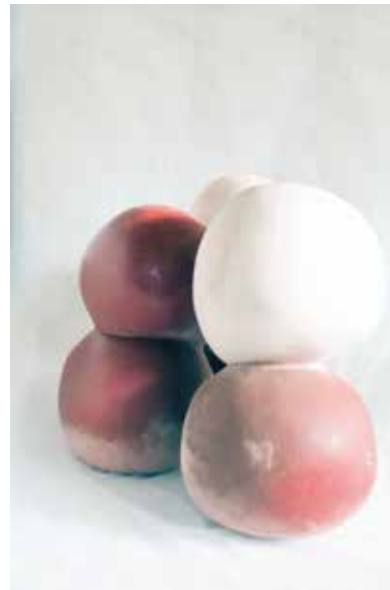
DHARMA 59x70x59 6-2017