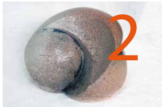
ÍMPETU 26x32.5x39 3-1986/4-2015