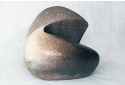
FLUCTUACIÓ 35x37.5x33 3-1986/10-2015