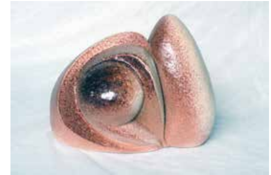
REVERENT 29.5x334x26 5-1986/11-2015