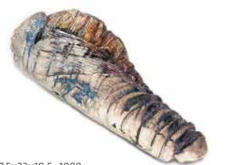
KAI 57.5x23x19.5 1988