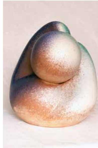
GARBULL 31x36x34 10-2015