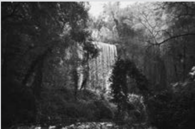
MONESTIR DE PEDRA