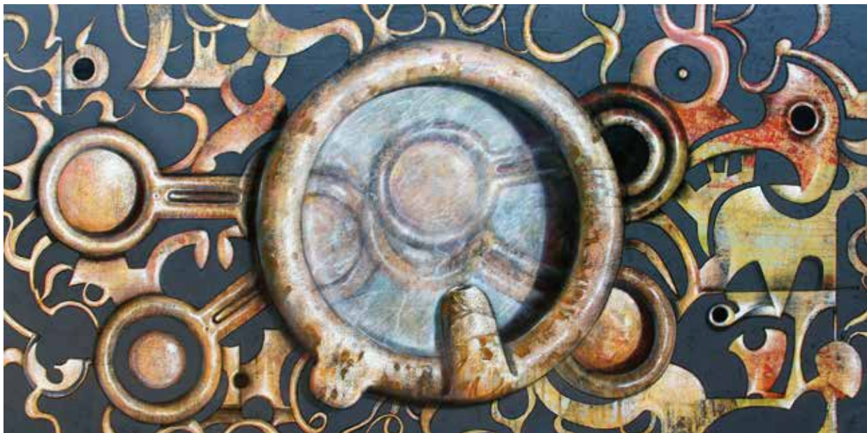
Ones sonores / tècnica mixta / llenç 90 x 180