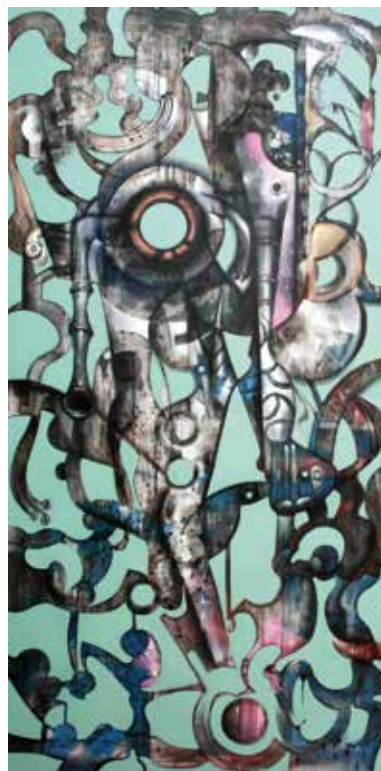
Cerca rítmica tècnica mixta / llenç / 195 x 97