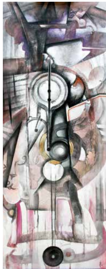
Ritme / tècnica mixta / llenç 150 x 60