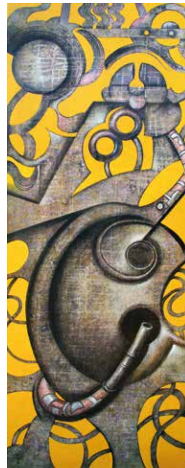
Instrument sonor tècnica mixta / 150 x 60