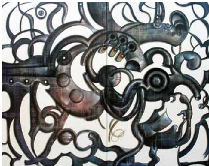
Sons en l'aire / llenç (díptic) 146 x 178