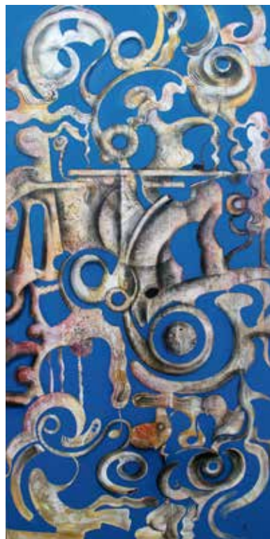
Sons harmònics tècnica mixta / llenç / 195 x 97