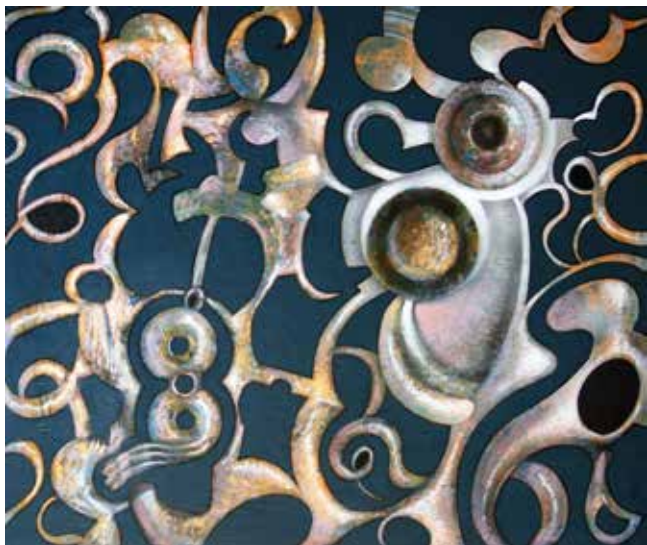
Sons metàl·lics / tècnica mixta / llenç 50 x 60