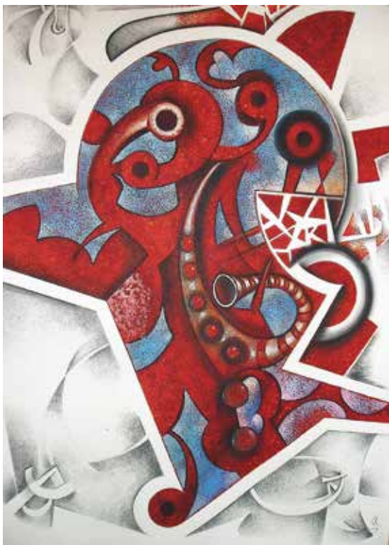
Origen dels objectes / tècnica mixta / llenç 107 x 78