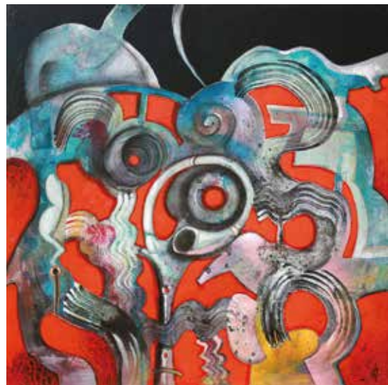
Moviments concordes / tècnica mixta / llenç 50 x 50