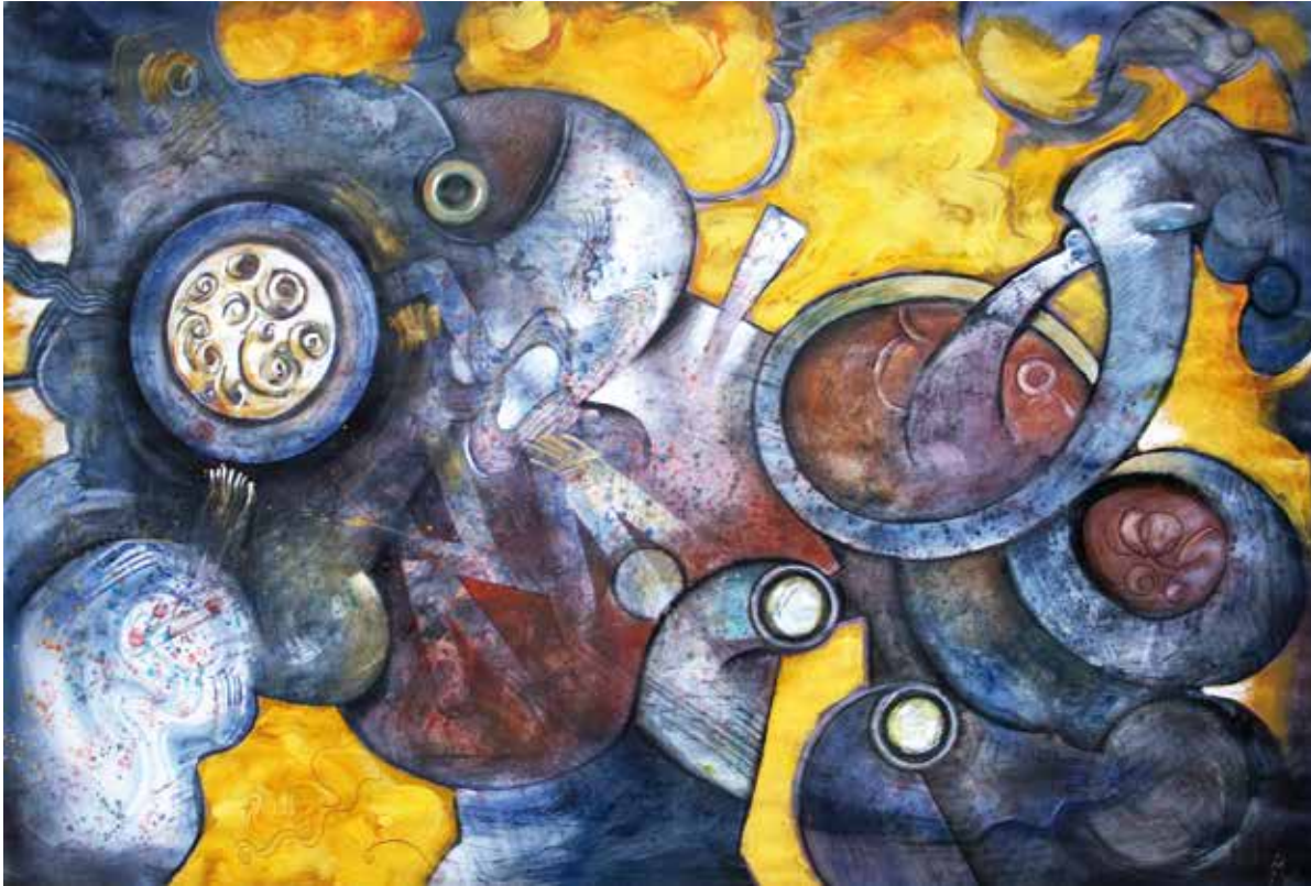
Moviments creadors / tècnica mixta / paper 72 x 107