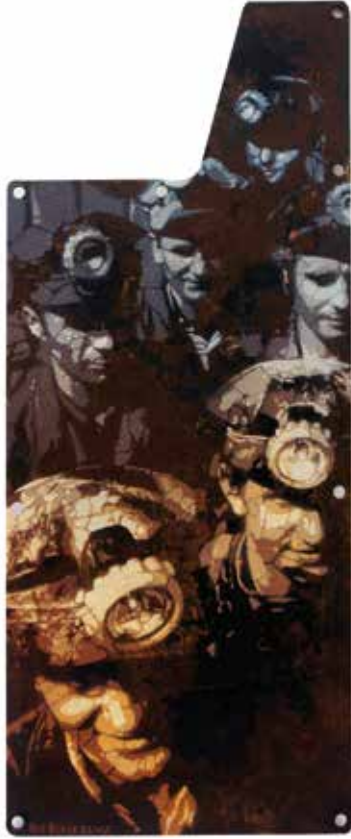
Iron men Roc Blackblock