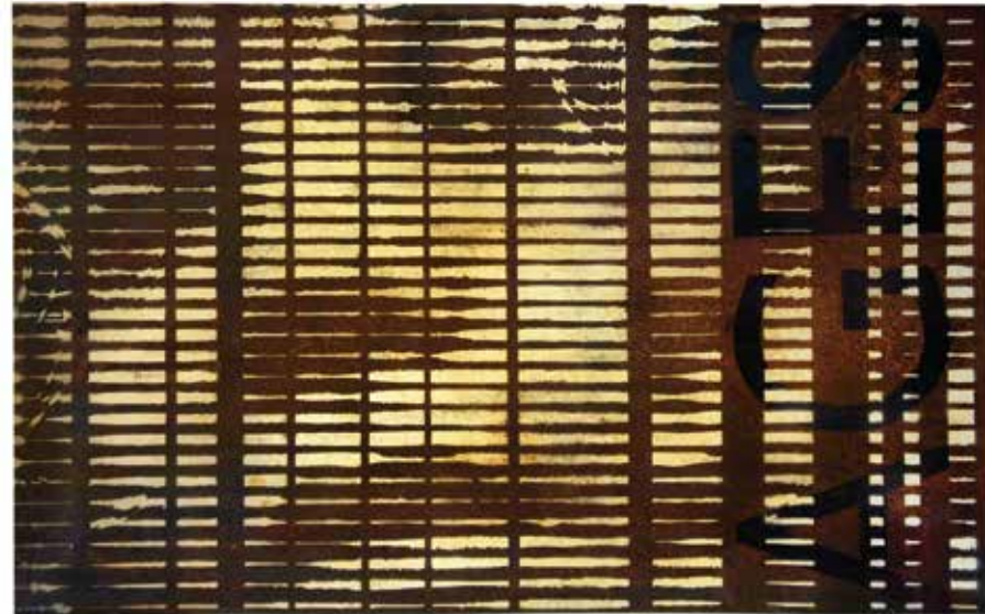
Ages Roc Blackblock