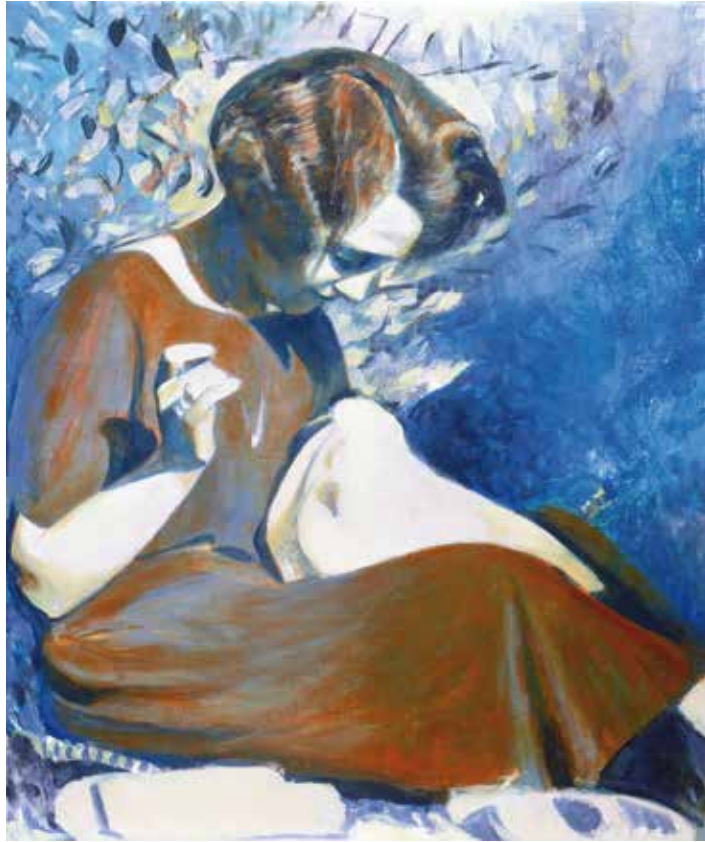
Júlia cosint Eva Agasa