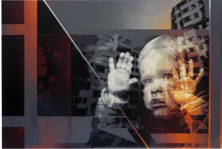
Allà fora Roc Blackblock