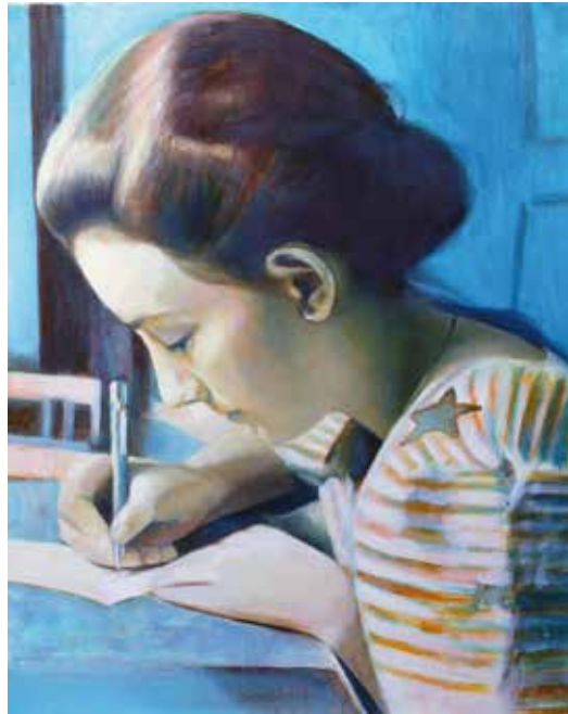
La carta Eva Agasa