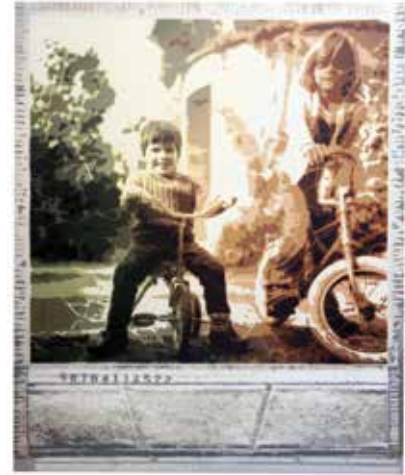
Golden years II Roc Blackblock