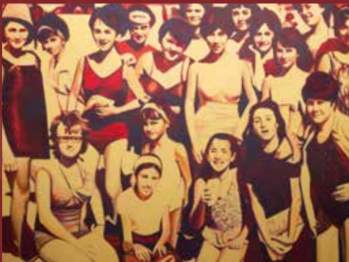
La platja Eva Agasa