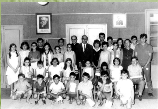
Grup d'alumnes de l'escola de música del Patronat de Música al saló d'actes de la seu del Rastre (1970 aprox)

Municipal fins l'any 1959. Aquest any, el consistori municipal, a instàncies de Francisco Queralt, Regidor delegat de Música, acorda la reconversió de l'Orquestra Municipal en Banda Municipal.