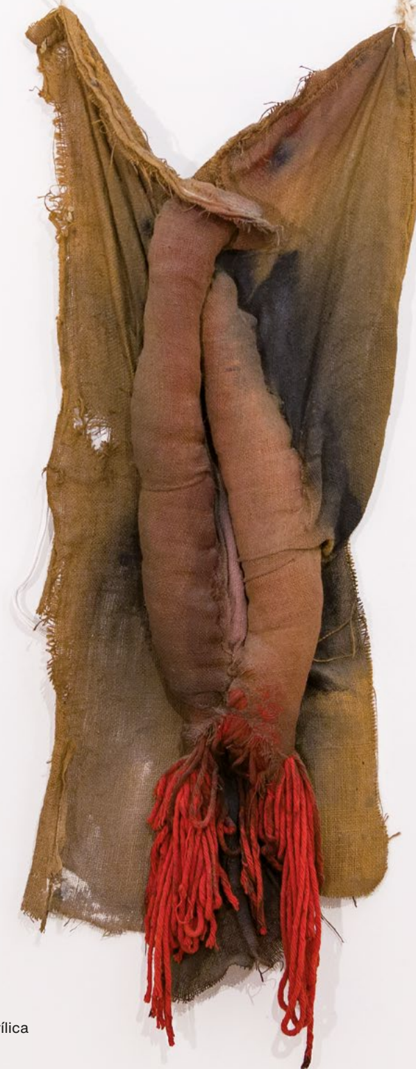
ST , 1981 Sac, cotó, llana i pintura acrílica 125 x 50 cm Col·lecció particular