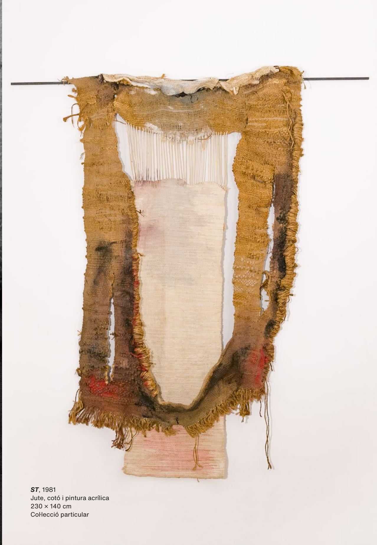
ST, 1981 Jute, cotó i pintura acrílica 230 x 140 cm Col·lecció particular