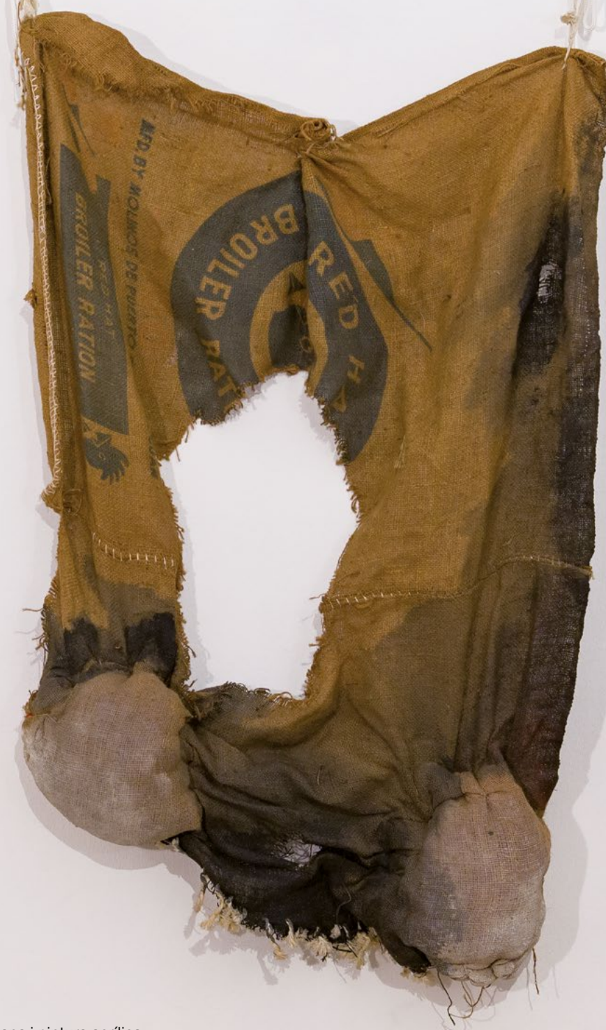
ST , 1981 Sac, cotó, llana i pintura acrílica 110 x 70 cm Col·lecció particular