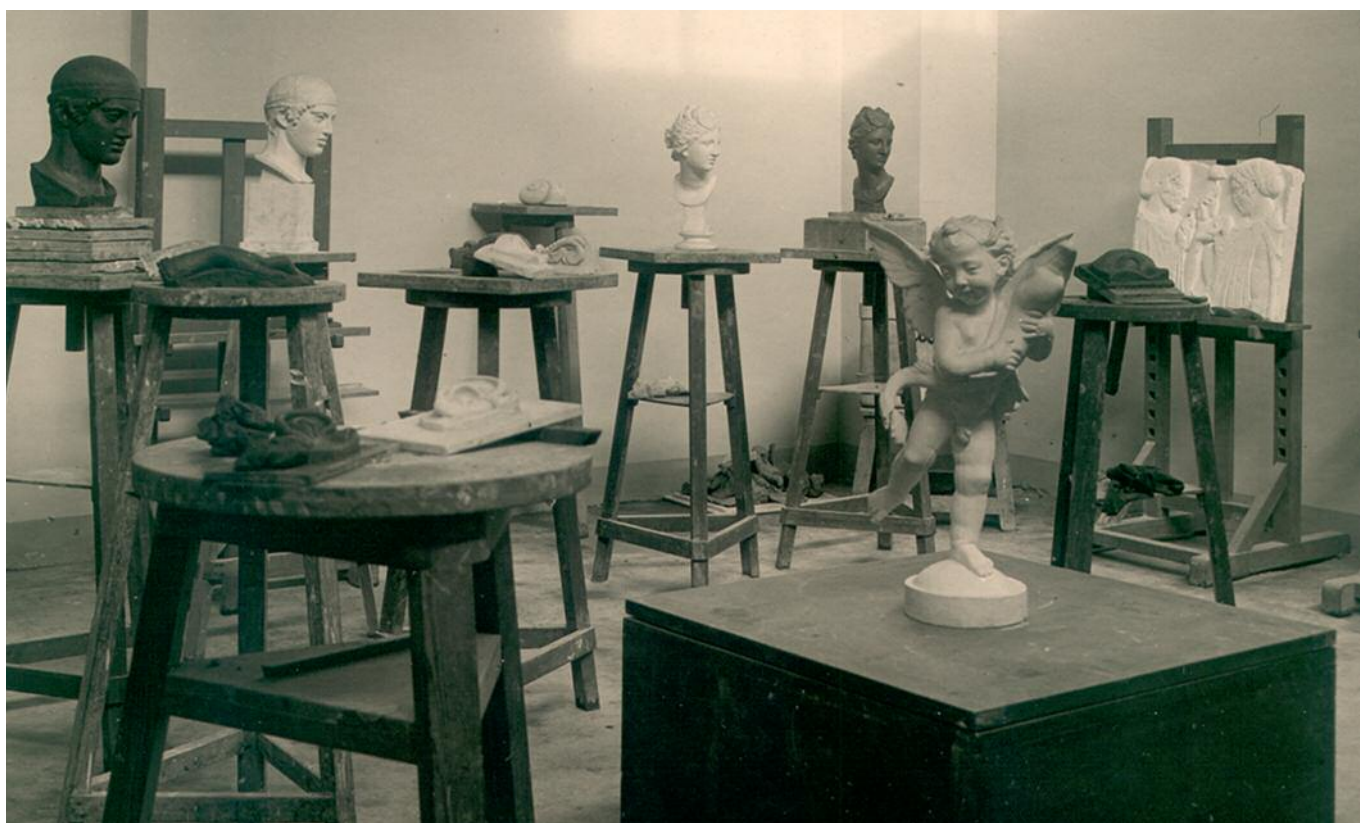
Taller amb emmotllats de guix per a la pràctica de l'escultura.

El Pla d'Estudis, amb una durada de dos anys, diferenciava les especialitats de pintura i escultura i establia assignatures comunes a ambdues especialitats: dibuix —d'emmotllats d'escaiola, flora i fauna, i còpia de grans mestres—, història de l'art, dibuix geomètric i projeccions —perspectiva i proporcions— i treballs manuals. Eren assignatures pròpies de l'especialitat de pintura: estudis preparatoris de color, color i composició i procediments pictòrics; mentre que a escultura hi havia: estudis preparatoris de modelatge, modelatge d'estàtues i del natural, i estudis pràctics de materials i procediments escultòrics.