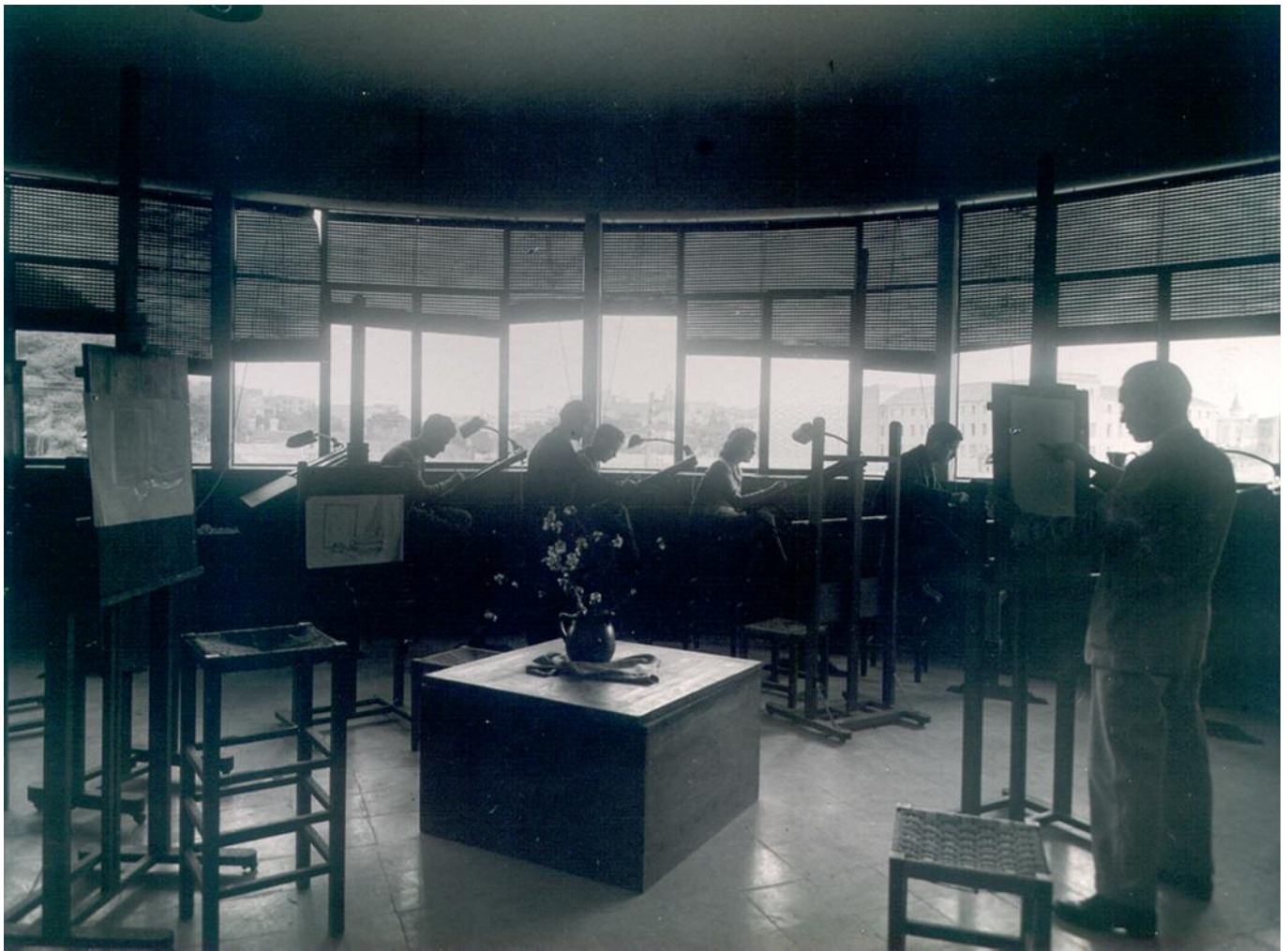
Una classe de dibuix a l'Escola d'Art. Al fons, a contrallum, es veuen les siluetes dels alumnes mentre treballen.