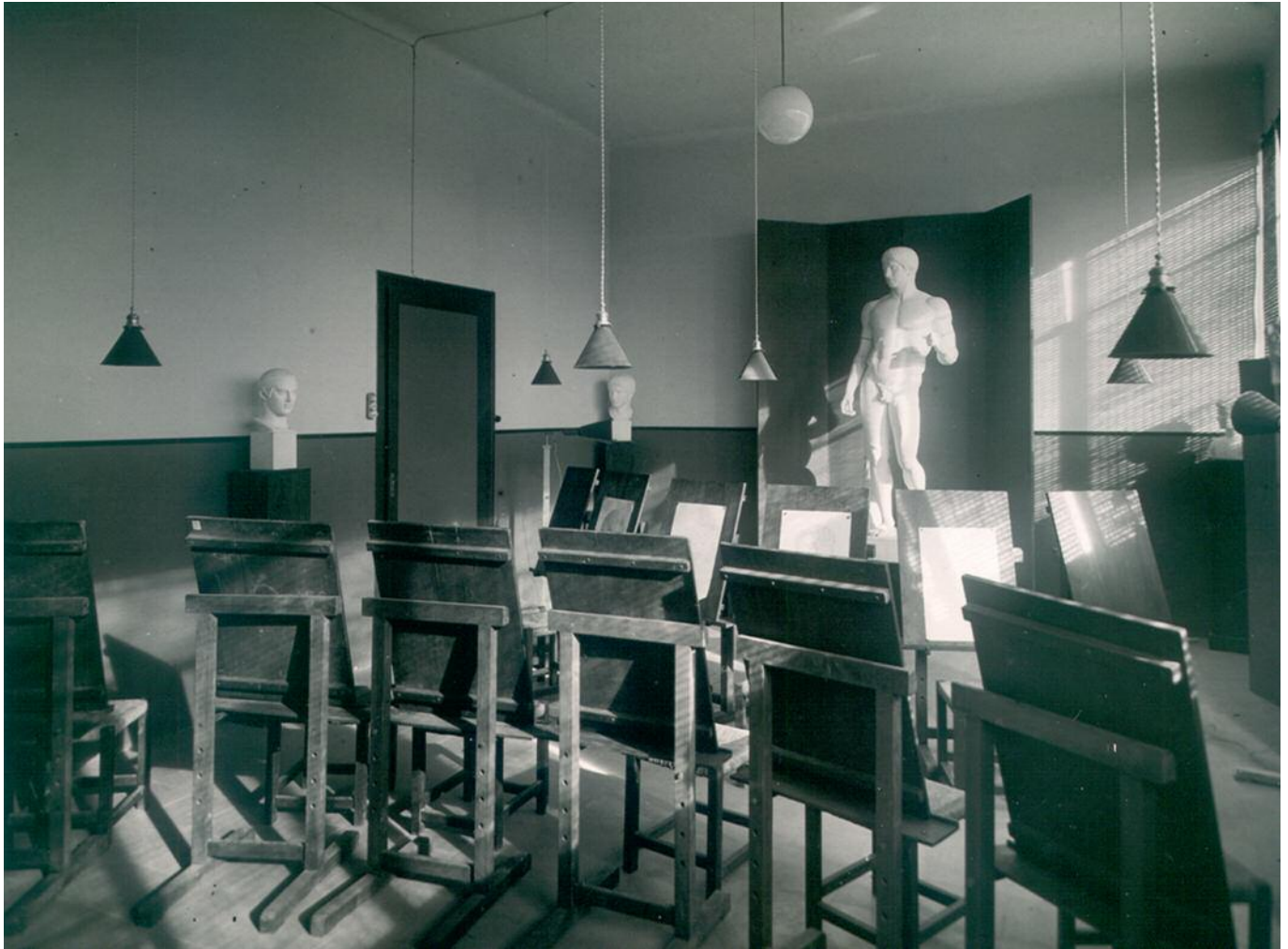
Vista de l'aula de dibuix, amb un model d'escultura clàssica.

Aquesta iniciativa d'inserir l'Escola d'Art dins l'Escola Elemental de Treball va tenir un ràpid i positiu ressò en el conjunt de Patronats Locals de Formació Professional de la província. El dia 15 d'octubre del mateix any, el president del Patronat de Reus s'adreçava al president de la Diputació per informar-lo que coneixia el projecte de forma oficiosa i el felicitava per la iniciativa, i alhora sol·licitava la implantació simultània dels estudis a les escoles de Tortosa, Valls, Reus i Tarragona, des de l'inici. 15 Malgrat l'interès manifestat, el desplegament d'aquests estudis es realitzaria amb posterioritat al 1950, quan l'Escola d'Art s'independitzà de l'Escola del Treball.