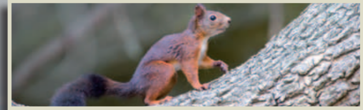
Esquirol Sciurus vulgaris