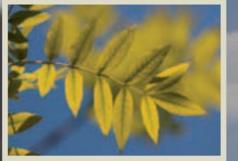
Freixe Fraxinus angustifolia