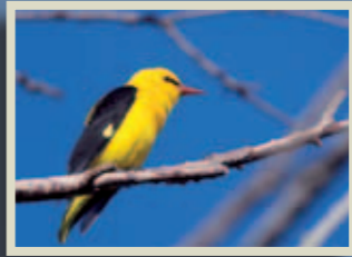
Oriol Oriolus oriolus