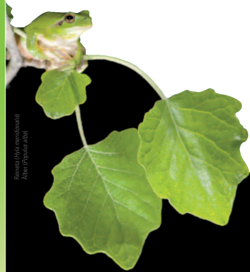
Reimera (Hyla meridionalis) Àlber (Populus alba)