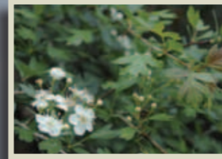
Arç blanc Crataegus monogyna