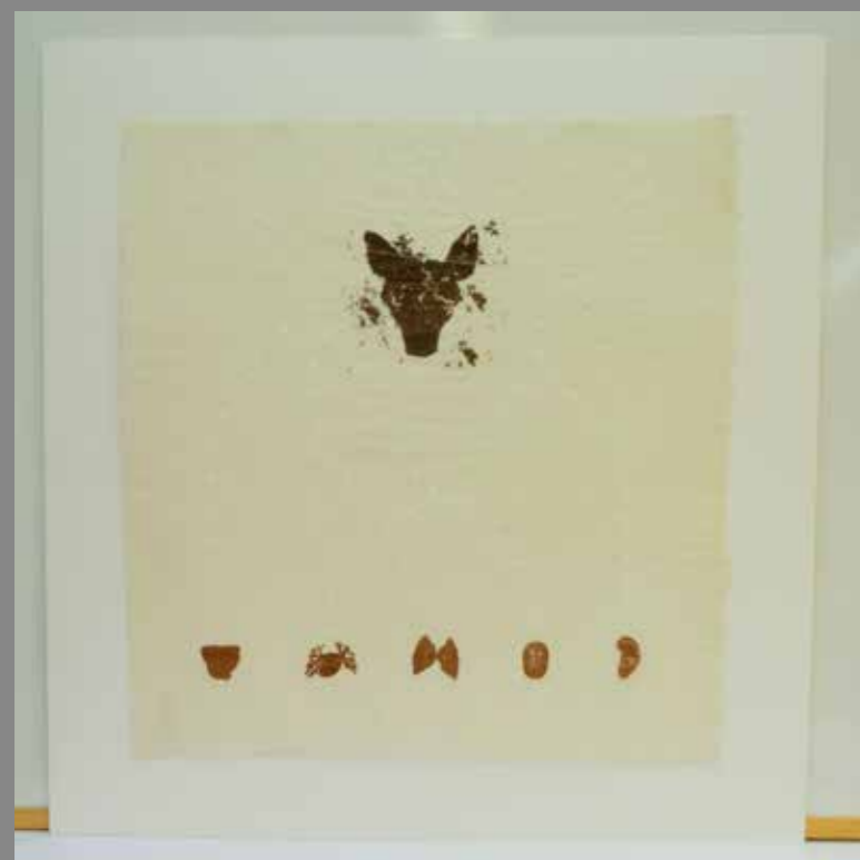
Gravat sobre paper japonès Títol: Pasajeros al tren Autor: Santiago González Dimensions: 670 x 620 mm

El cartró va salvar la integritat de l'obra perquè la va protegir de l'aigua i de l'atac de microorganismes, però aquests tipus d'infeccions s'escampen ràpidament i es va fer evident la necessitat d'una intervenció d'urgència per evitar el contagi i la destrucció de l'obra.