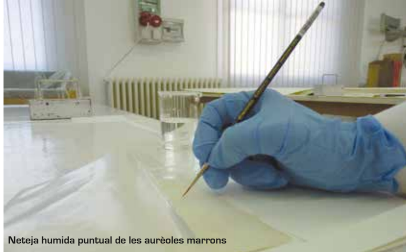
Neteja humida puntual de les aurèoles marrons

Es va col·locar el gravat a la taula de succió amb la zona tacada a sobre d'un material absorbent (paper filtre amb pols de talc). A continuació es va dipositar aigua sobre les taques i la succió va facilitar que es trasladesin al material absorbent, desapareixent de l'obra.