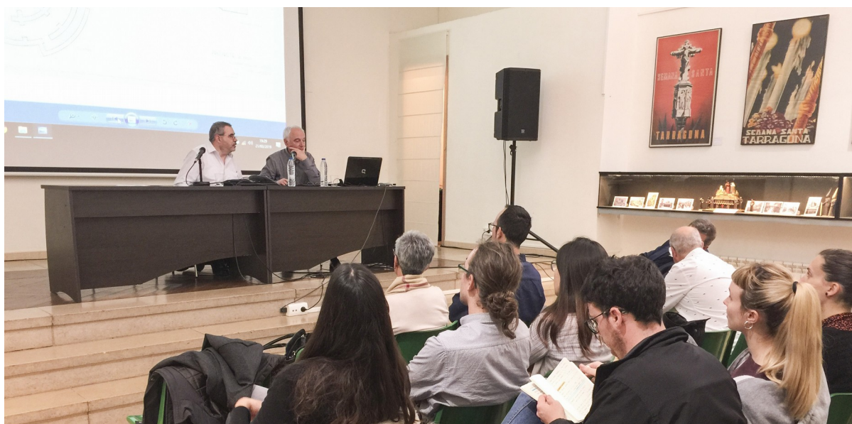
Conferència sobre els refugis de la Guerra Civil al Museu Bíblic de Tarragona.

19 de desembre: Visita dels treballadors de l'Àrea de Secretaria de la Diputació de Tarragona.