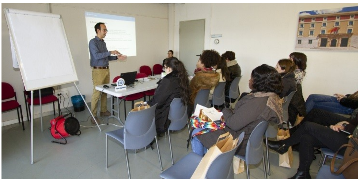
Visita a l'Arxiu dels alumnes del Centre d'Estudis i Orientació Professional.