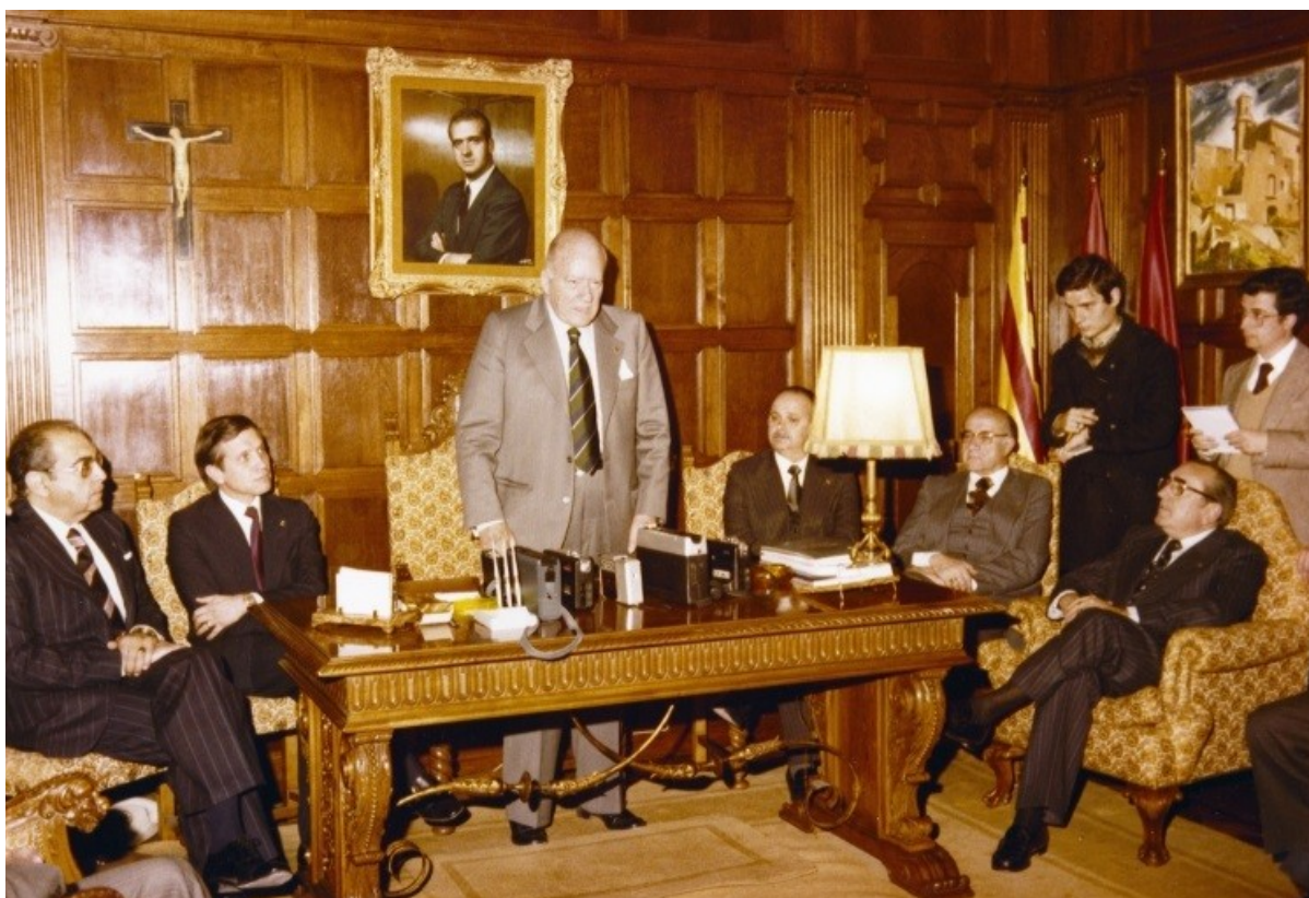
L'Àlbum de l'Arxiu 04. Visita del president Tarradellas a la Diputació de Tarragona.

S'ha continuat el projecte de difusió del fons fotogràfic històric L'Àlbum de l'Arxiu , amb 3 noves edicions.